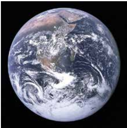
Die Erde, aufgenommen von Apollo 17 am 7. Dezember 1972

Als Wissenschaftler am Beginn der Neuzeit das alte Weltbild, dass die Erde im Mittelpunkt des Universums stehe, aus den Angeln hoben, begann eine Revolution, die bis zum heutigen Tag anhält: Man spricht vom Urknall, von Millionen von Galaxien, vom Entstehen und Vergehen der Sonnen, von Atommodellen, von dunkler Materie und dunkler Energie, usw.