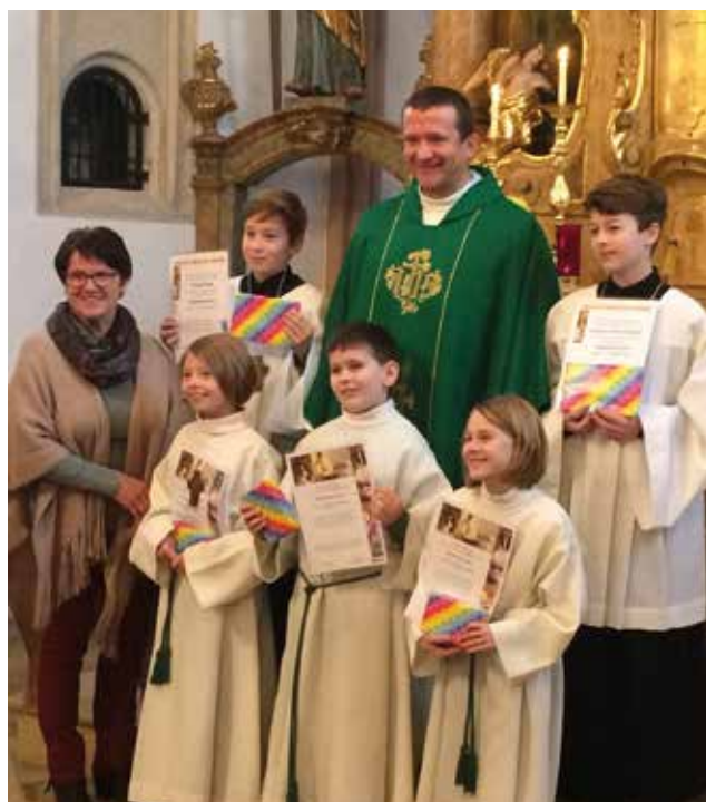
Die neuen Ministranten und Oberminis aus St. Martin.